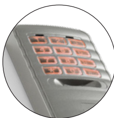
ÜTÉSÁLLÓ TARTÓ POLIKARBONÁTBÓL HÁTTÉRVILÁGÍTÁSSAL DKSDUALT