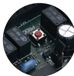
1000 KÓD MEMORIZÁLÁSA