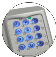
GOMBOK HÁTTÉRVILÁGÍTÁSSAL DKS250TL

A DKSDUAL egy multifunkcionális biztonsági rendszer, amely egyetlen termékben egyesíti a DKS250 és a DKSTP funkcióit. Az eszköz ütésálló polikarbonát IP57 tartóban van, háttérvilágítással, állítható fényerővel, amit egy fényérzékelő és egy közelség-érzékelő automatikusan vezérel.