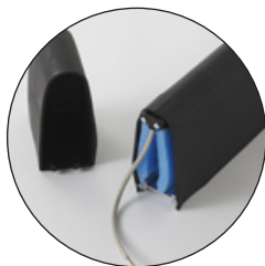
VEZETŐ BIZTONSÁGI ÉL 8,2kΩ KAPCSOLAT