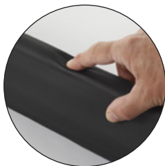
MAGAS PROFILÚ PASSZÍV ÉL