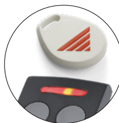
S500 ADÓK ÉS PROXIMITZK LEOLVASÁSA RFID TECHNOLÓGIÁVAL